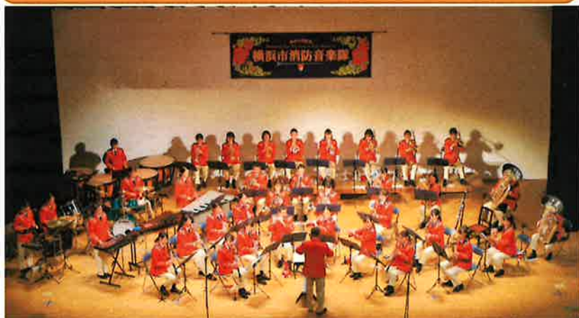
横浜市消防音楽隊 プロフィール